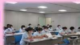
eラーニングでの集合研修

院内における医療スタッフの一員として医療関係者と看護補助者が円滑に協働するために医療種組織人としての心構えや接遇を中心に学び、看護サービス全体を向上させる活動を行います。