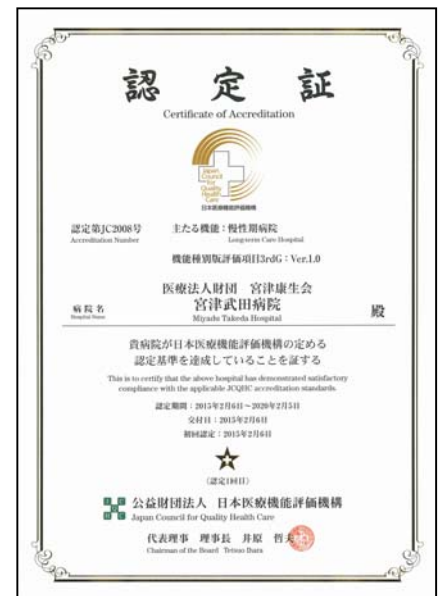
日本医療機能評価機構の認定証