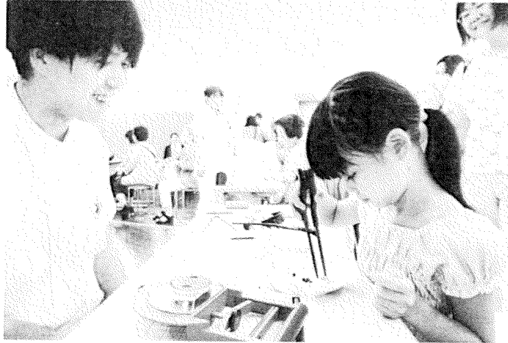
リハビリ器具のはしを使った作業に挑戦する来場者