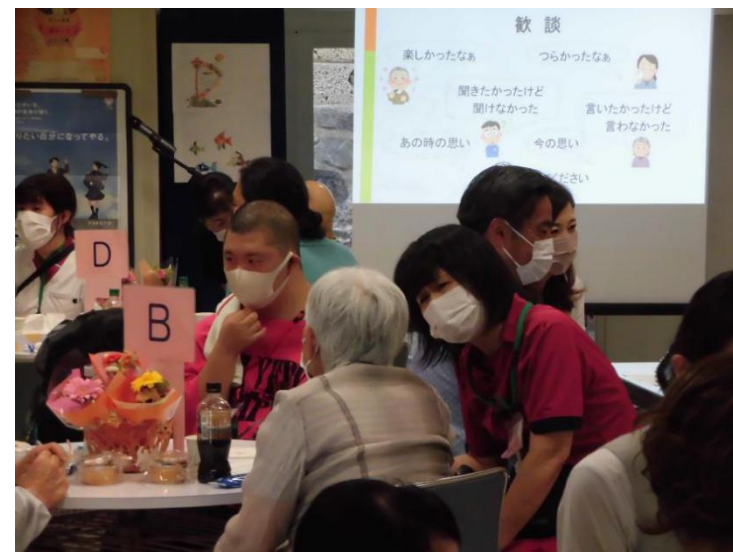
当時にタイムスリップしたように、思い出が湧き上がってきます。 懐かしいスタッフと思い出話に、泣いたり、笑ったり、和やかな時間を過ごしました。