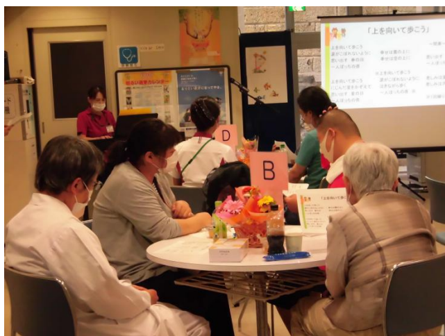
「上を向いて歩こう」をスタッフのピアノ演奏で 参加者みんなで歌いました。