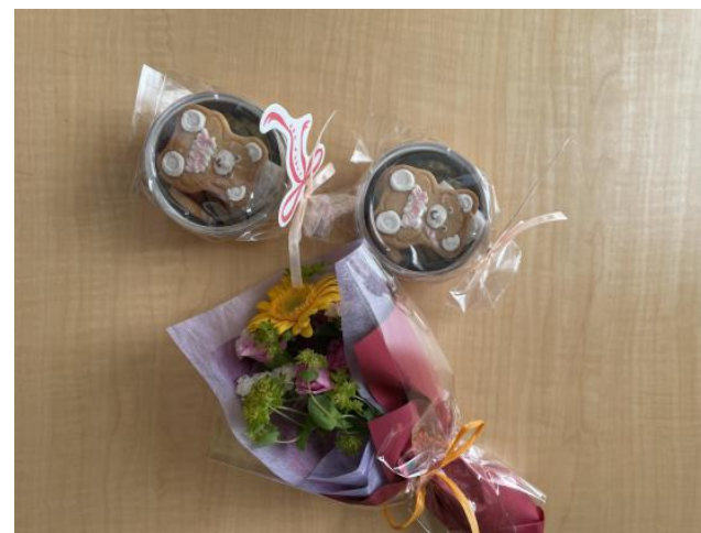
遺族会に参加していただいて、ありがとうございました。 お会いできて、とってもうれしかったです。