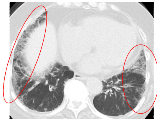
図2 間質性肺炎のCT画像（肺の一番下の断面）