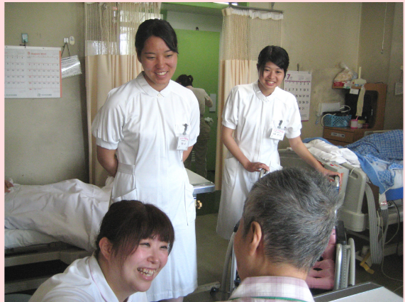
患者さんとのコミュニケーション