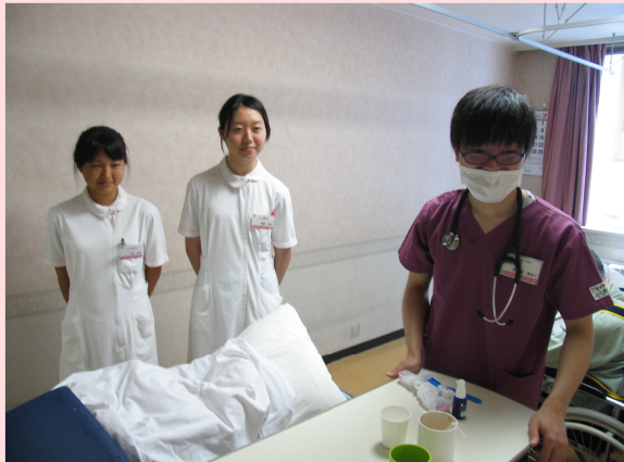
患者さんの療養環境を整えます