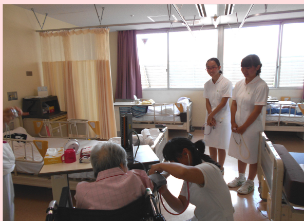
血圧測定をさせていただきました！