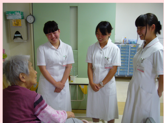
患者さんに励まされ・・・人生勉強になりました