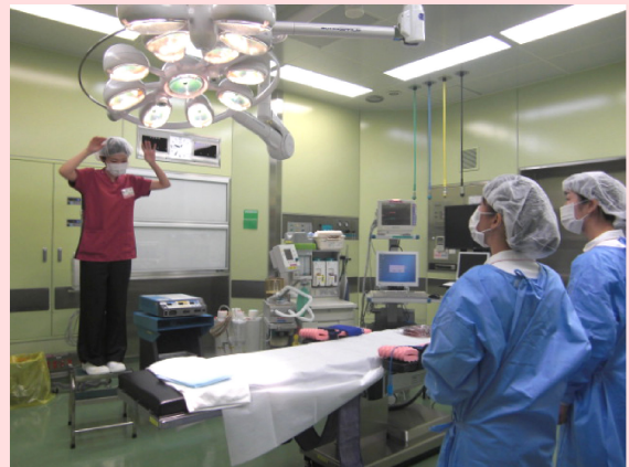
ドキドキしながら手術室で