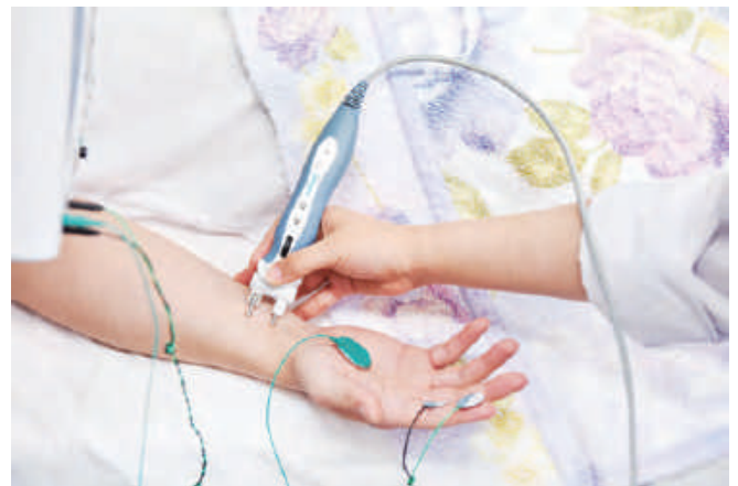
末梢神経に電気を流して反応を見る