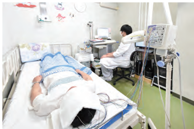
脳波の異常を専門医が判読