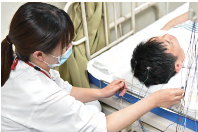
患者さんの頭皮に電極をつけて脳波を測定