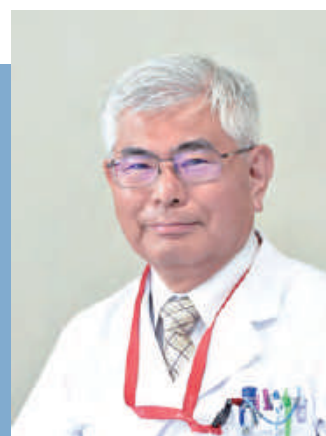
顧問 / 臨床研修部 部長

専門外来として、神経筋クリニック（末梢神経障害や神経筋疾患の電気診断）、脳波外来（てんかん診療）、神経筋外来（不随意運動や痙縮に対するボツリヌス治療など）があり、より専門的な診断・治療を行なっています。