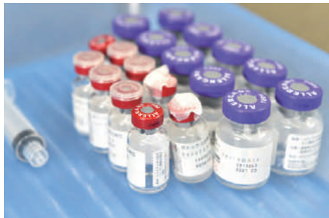
ボツリヌス療法（ボトックス）