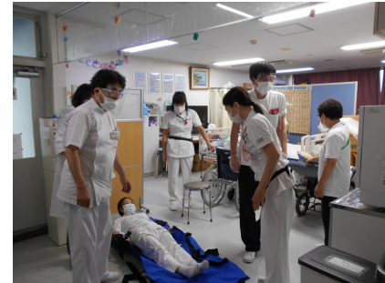
EVIと並行して、階段で避難、昇降では苦勞する場面も。