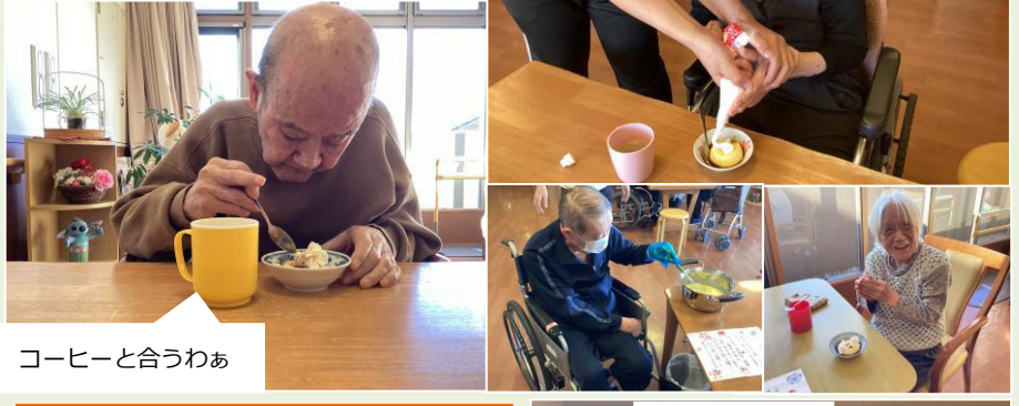
コーヒーと合うわあ

人気の高かったデザートプリンを皆で一緒に作りました。お供はカフェオレと牛乳を併せた和コーヒーです。お味はいかがですか♪