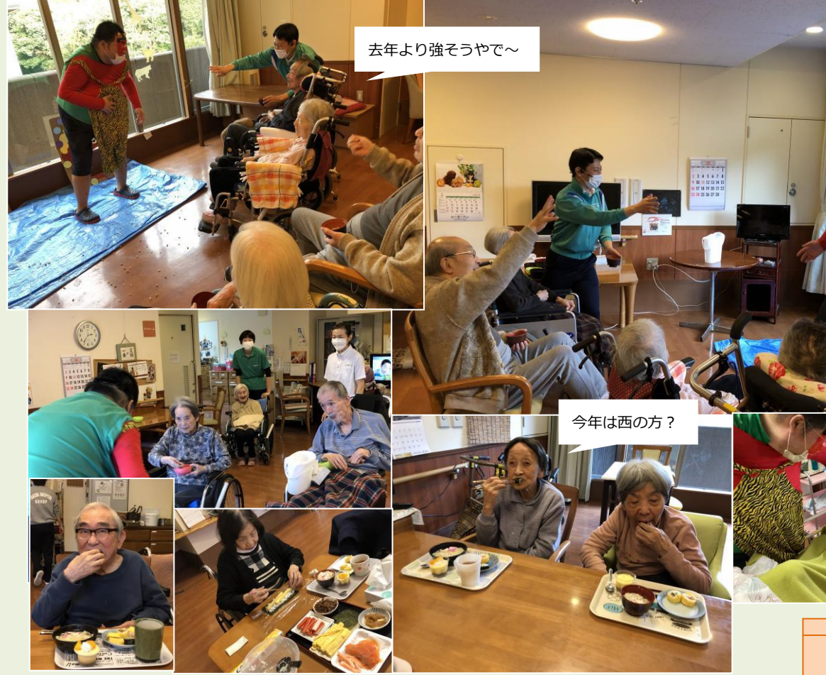
去年より強そうやで～