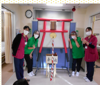
木津屋橋神社 初詣