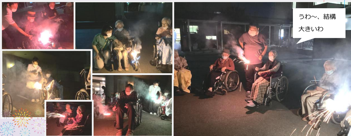
うわ〜、結構大きいわ

Villa稲荷山恒例のミニ花火大会。皆さん気に入った花火を手に取り、「綺麗やねえ」「懐かしいわあ」と、童心に帰って過ぎゆく夏を満喫されていました♪