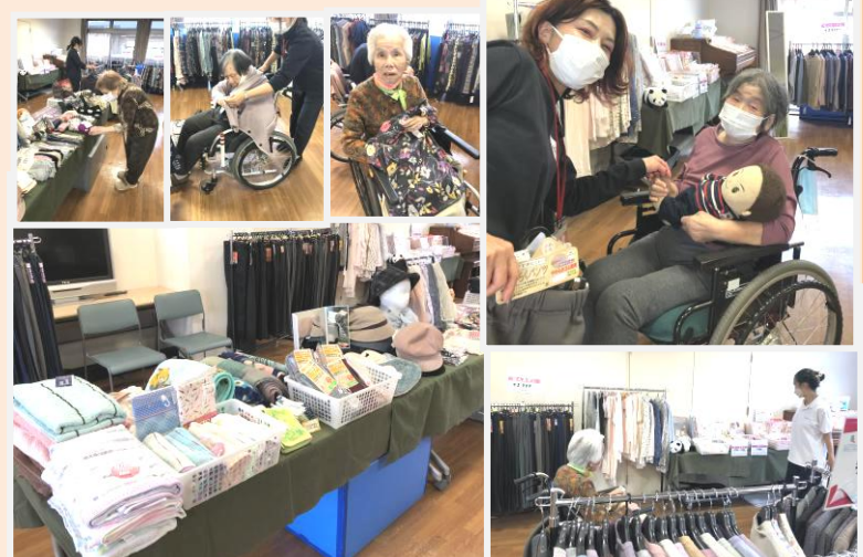
母娘一緒にお買い物♪

今年度から始まった新企画の第2弾、衣料品の出張販売です。今回は秋冬物を取り揃えました。どうです、気に入ったものはありましたか?