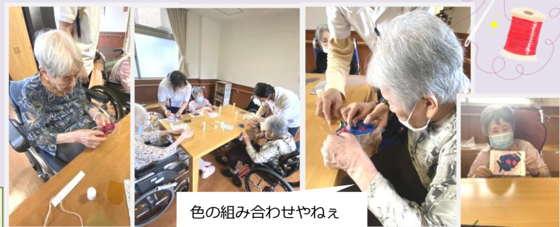
色の組み合わせやねえ

手指の動作訓練を兼ねた手芸教室。セロハンとアクリル板を使ってお洒落なスタンドグラスを作りました。お部屋飾りにどうぞ♡