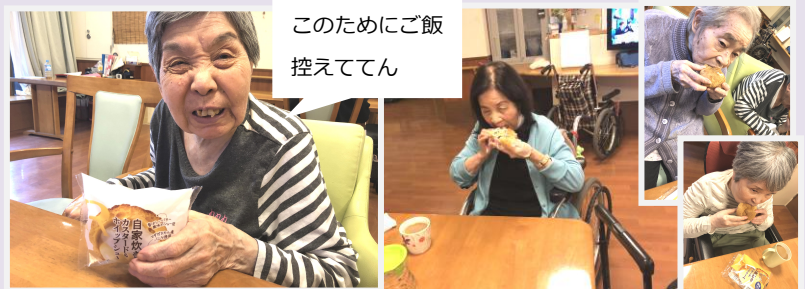
このためにご飯控えてん

シリーズ企画、おやつの日曜日。皆さんのリクエストにより今回はシュークリームです♪