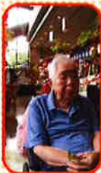
井筒八つ橋工場本舗 追分店に、 見学に行きました！