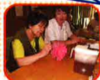
お誕生日 おめでとう！