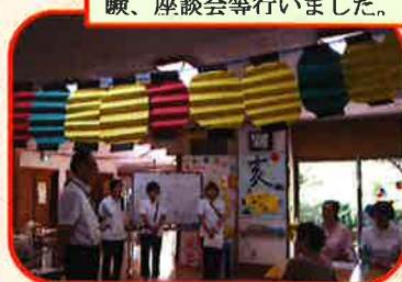
8/25(日)にはお忙しい中、5家族9名の方 にお越し頂き家族交流会を開催しました。 勉強会やポジショニング体験、高齢者体 験、座談会等行いました。