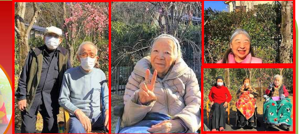
梅の花咲く施設の庭を皆様と散歩しました！春はすぐそこですね！