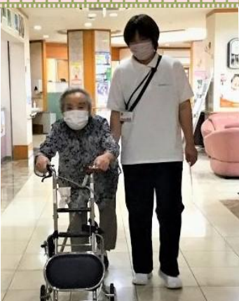
14:00 「家ではじっとして います」とご本人。 歩行訓練 3周歩いて