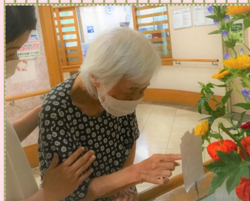
10:30 散歩の途中に、 花の名前を確認中。 「かわいい花♥」