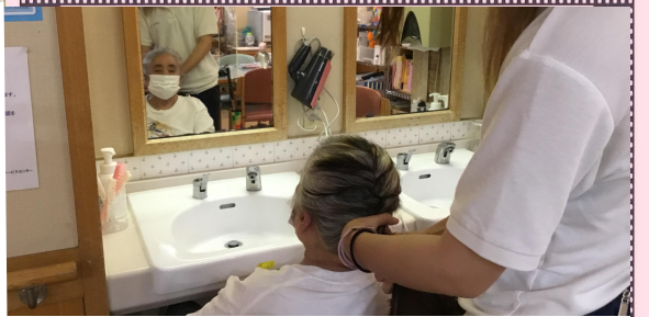
10:30 入浴後鏡の前で髪の設定中。 「(私) いいでしょ♪♪」