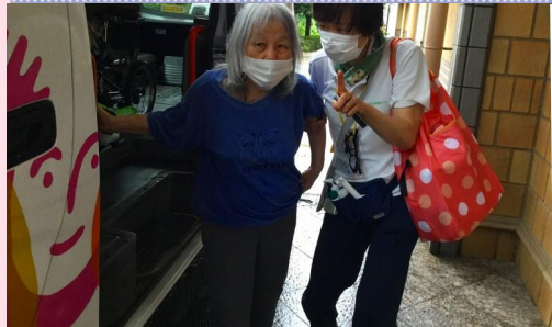
8:30 おはようございます！ 出発前の検温は問題なし。 10:30 楽しみましょうね♪

デイサービスのいち日を、【朝のお迎え】から【お帰りのお送り】までをご紹介します。