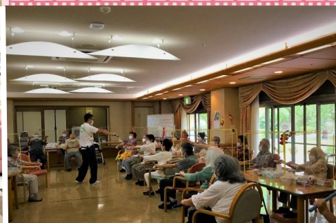
13:00 3密を避け、定期的に換気するなど、感染対策をしっかりと 14:30 行ないながら、体操やレクリエーションも楽しんでいます♪