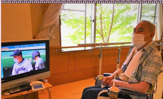
13:30 高校野球応援観戦！ 「頑張れ★高校球児」