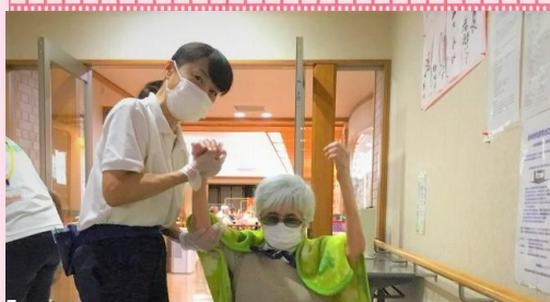
14:00 理学療法士による、 個別リハビリです。