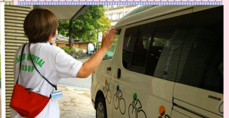
16:30 職員の見送り。 安全運行で！ またお待ちしております。