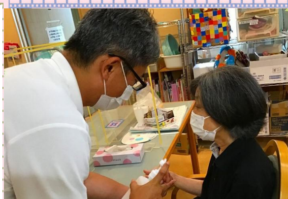
適宜 終日、手指消毒を 適宜行い、感染 予防に努めています。