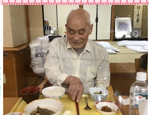
12:00 ランチタイム♪ きょうは魚の煮つけが グワッ