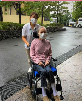
10:00 施設に到着しました。 今日も穏やかに、 元気に過ごしましょう。