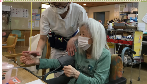
10:15 朝の健康チェックです。 看護師による血圧、 体温測定をしています。