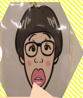
お庭に8個隠された僕の顔を探してねby ひよっこはん