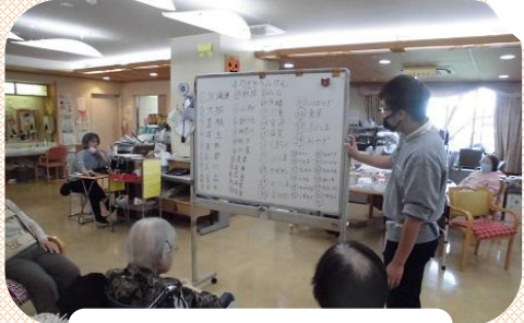
ホワイトボードレク