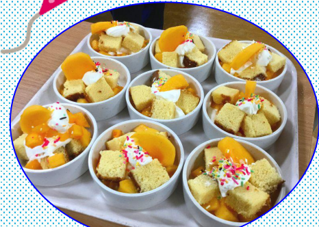
綺麗にできました！！

10月25日に特養2階でおやつ行事を行いました。カステラと柿を使ったおやつで、職員が砂糖やバニラエッセンスでクリームを作成し、見た目も華やかに仕上がりました。ご利用者さんも大変喜ばれていました。