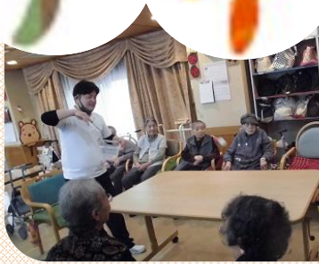
ピンポン玉キャッチゲーム