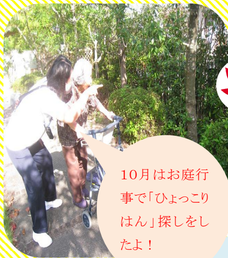
10月はお庭行事で「ひよっこはん」探しをしたよ！