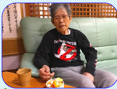
甘くて美味しいよ！