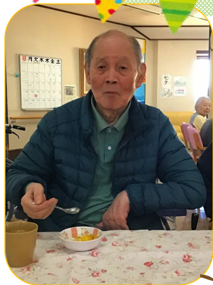
笑顔がうれしいです！