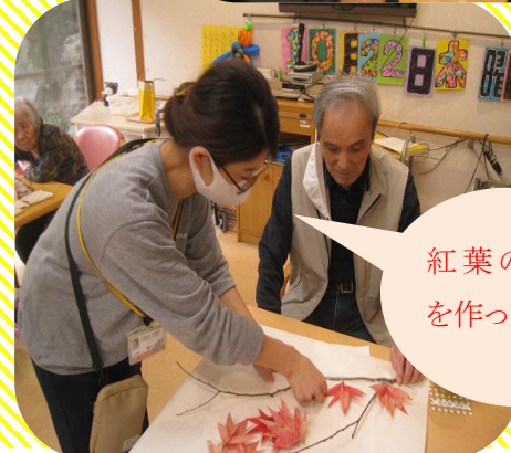
紅葉の壁画を作ってたよ