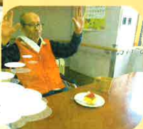
手作りケーキ完成!!