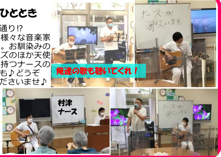
俺達の歌も聴いてくれ!