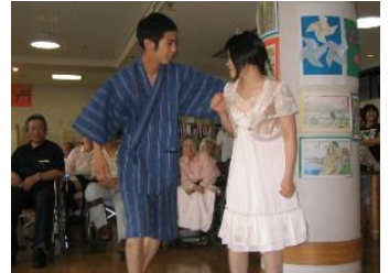
最後にはめでたくゴールイン!