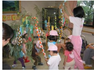
園児との飾り付け