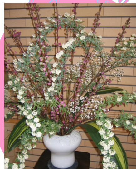
桃こでまり 縞はらん

平成17年4月より施行された個人情報保護法により、今回掲載しております写真等は利用者様の了承を得ております。