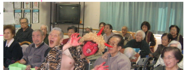
鬼と一緒にハイ、チーズ