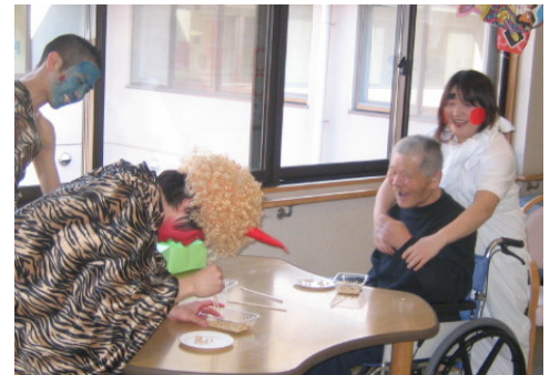
鬼と対決、やっつけろー！！

2月3日に節分祭を実施しました。 皆様、突然現われて暴れだす鬼と正義の味方お多福の登場にとっても喜ばれていました。 鬼と各階代表利用者様とのゲーム対決(豆運び)でも皆さん「鬼にまけるなー！」と応援を一生懸命して下さいました。 最後に、鬼に向けて豆まきをしました。皆さん「鬼は一外！福は一内！」大きな声で豆をまかれています。そして、その皆さんの大きな声とパワーに鬼もたまらず退散していきました。 今年も、皆さんに福が来ることは間違いないと思った節分祭でした。