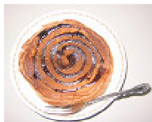
さあ出来上がり。とても美味しそう！