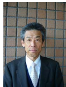
加茂町高齢者 福祉センター