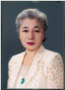
社会福祉法人 青谷福祉会