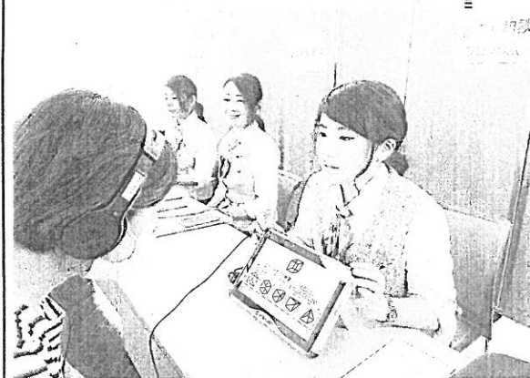
最新機器で「もの忘れ」をチェックするコーナー

また、最新機器による「もの忘れ相談プログラム」、系列のウィラ鳳凰による脳年齢測定なども好評だった。