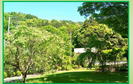
当施設のお庭です。

また、デイサービス、オレンジデイサービス両センターにおいては、今月5月26日（日）午後1時半～に家族交流会を予定しております。ご利用者のよりよい支援・介護などを目的に、ご家族と職員及びご家族同士による交流を深める場として開催いたしますので、当日参加者の皆様にはどうぞよろしくお願いいたします（※特養は6月下旬に開催予定）。