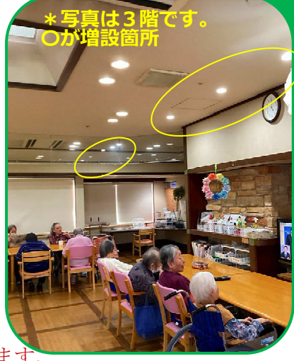
*写真は3階です。○が増設箇所

ご利用者の日々の生活環境については、今後とも必要に応じて適宜改善を進めてまいります。